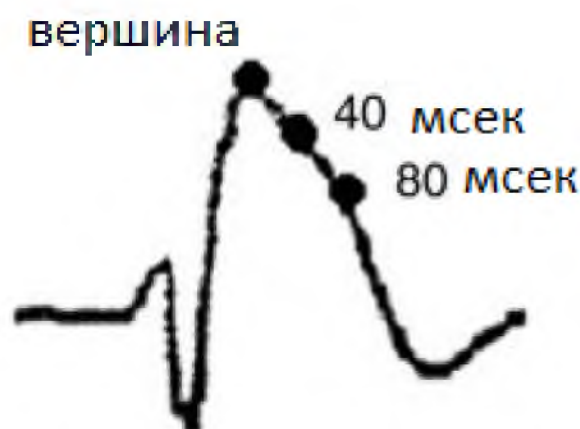
Рисунок 2 – «Сводчатый» паттерн BrS (тип1)

T \leq 4 мм; высота ST в точке, отстоящей от вершины зубца T на 40 мсек больше, чем в точке, отстоящей от вершины зубца T на 80мсек (рис.2).